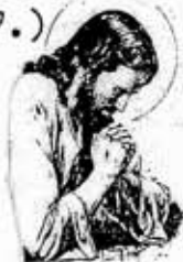
Isus je živ!