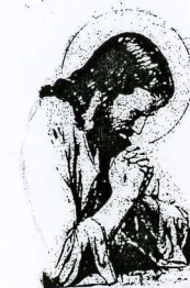
Isus je živ !