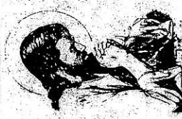
Isus je živ !